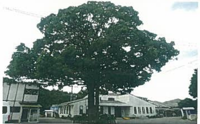
多良岳福祉園のシンボル 楠木