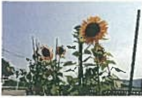
<みんなで育てたひまわり>