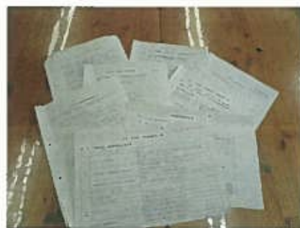
みなさんが立てた事業計画

今年度の事業計画は職員が立てたものです。職員ひとり一人が、課題に対して果敢に挑戦し、そして2人の部長が、みなさんの夢実現の為に、しっかりフォローしてくれる事を信じ、私も職責をしっかり果たしていく決意です。今年度も見守ってください。